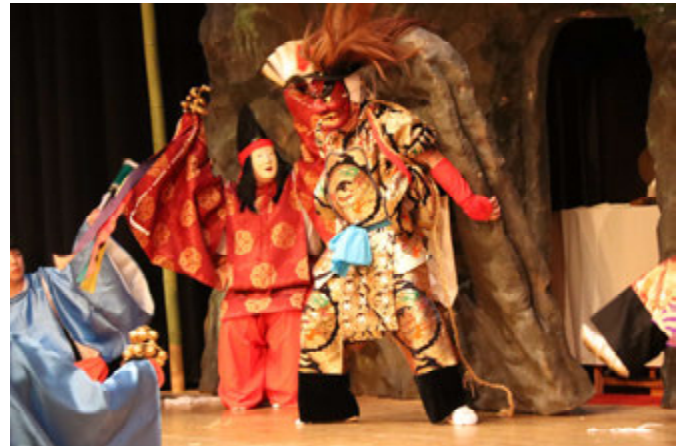
▲庄内原神楽保存会 第3幕「大蛇退治」