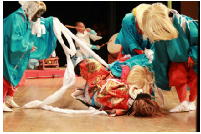
▲庄内原神楽保存会 第1幕「二草」