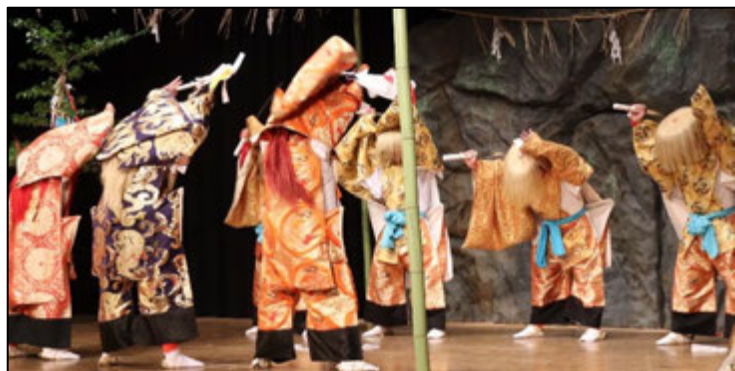
▲第1幕 緒方三社神楽保存会「貴見城」