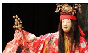
▲第3幕 緒方三社神楽保存会「天孫降臨」