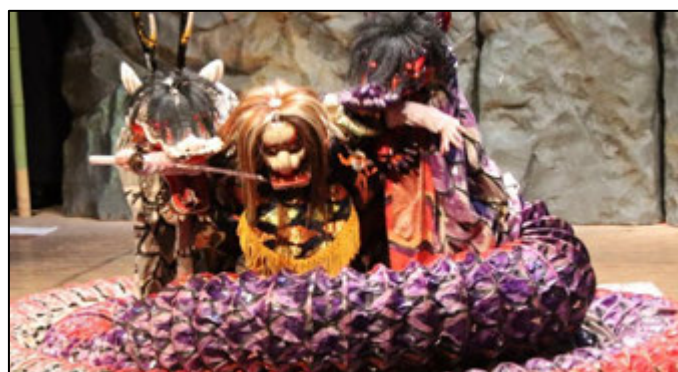
▲第4幕 片島里神楽「大蛇退治」