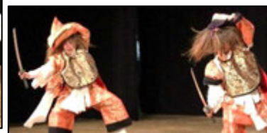
▲第2幕 片島里神楽「剣舞」